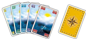
60 Wetterkarten (Werte 1 - 60)