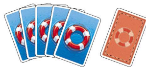
24 Rettungsringkarten (alle identisch)