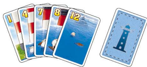
24 Flutkarten (Werte 1 - 12, je zweimal)