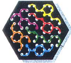
Beispiel B: So dürfen die Farbsteine nicht auf dem Spielbrett plaziert werden.