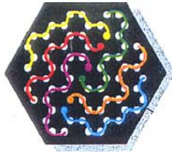
Beispiel A: Diese Farblinien wurden richtig gelegt.